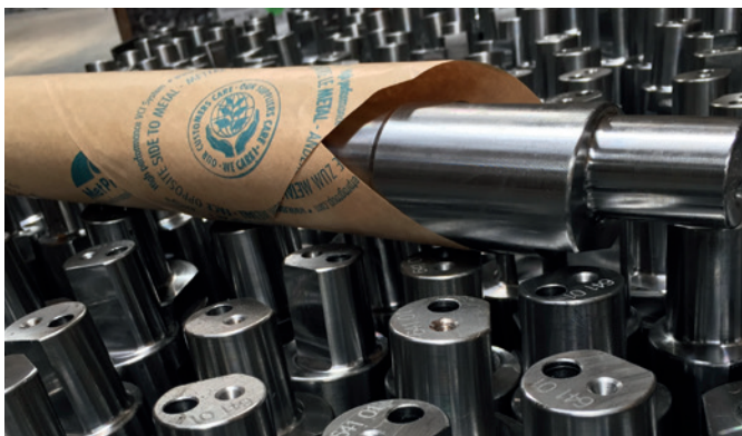
Perfekt verpackte Einzelteile, ideal für die Industrie

Sprechen Sie uns an, unsere Fachberater unterstützen Sie bei der Wahl der richtigen Spezifikation: www.metpro.de