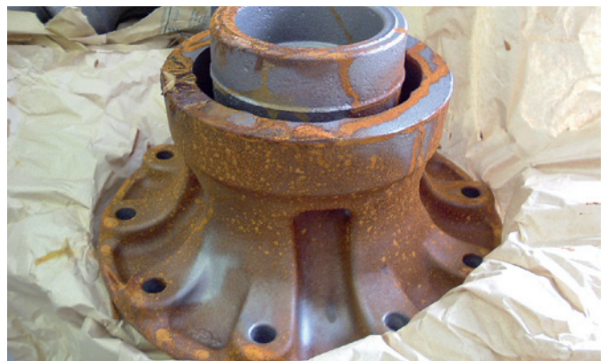
Ware nach Transport ohne VCI-Schutz