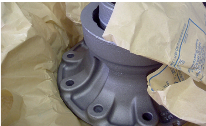
Ware nach Transport mit VCI-Schutz