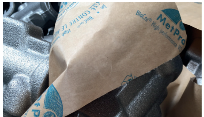
Gut geschützt mit BioCor® VCI-Papier